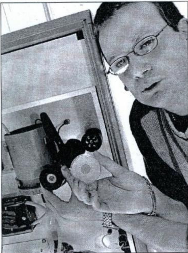
Les algues réagissent à la présence d'herbicides par variation de fluorescence.

La pollution de l'eau détectée par la réaction d'une algue ? La solution que propose le capteur biologique Fluotox, une innovation industrielle née dans le département.